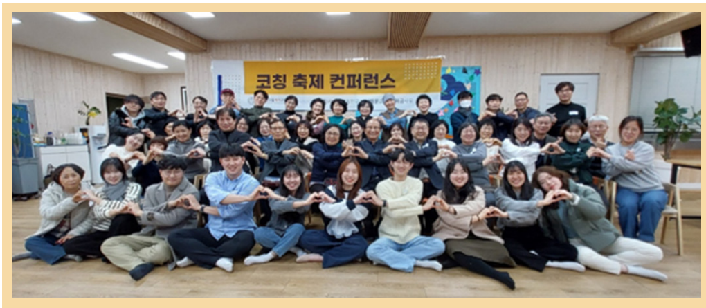
<그림 6> 전주 온고을 제자 교회 코칭 축제 컨퍼런스(2024.1.13)