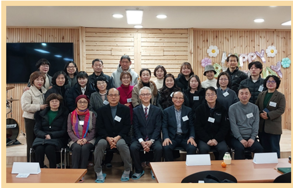
<그림 7> 선산읍 교회 교육부 코칭(2024.1.20)

2024년 1월20일(토) 오전 10:00-오후 12:30 구미 선산읍교회 교육부 주최 교육부 교사들 대상으로 한 코칭 세미나가 2년째 열렸습니다. 유아, 유치, 유년, 중고등부에서 각 부장들과 교사들이 모여 첫 시간은 교사들을 위한 사명, 비전 그리고 핵심가치를 중심으로 코칭 강의, 둘째 시간은 2023년 성취한 목표와 실행전략을 나누는 시간을 가졌고, 또한 사전에 작성한 2024년의 목표와 실행전략 기획안을 중심으로 각 부장들이 전체 앞에서 발표하는 시간을 가졌습니다. 작년 모임은 각부장과 1-2명의 교사들만 참석하였지만 올해 모임에는 부장들과 모든 교사들이 참여하는(약 25명정도) 모임이었습니다. 올해의 목표와 실행전략의 훌륭한 성과를 기대합니다.