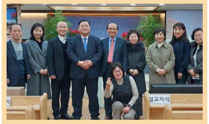
<그림 5> 서울 동대문구 영신교회 조직 코칭팀(2024.1.14)