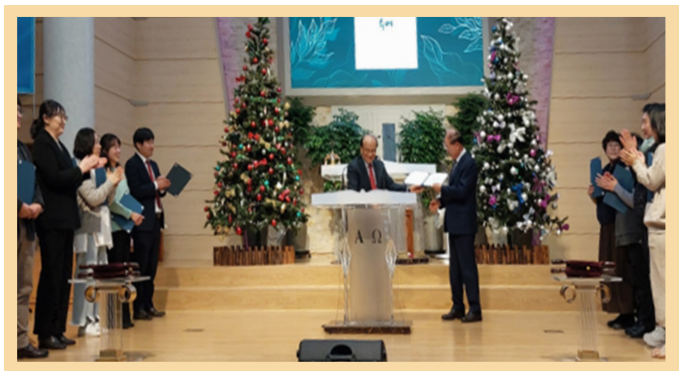
<그림 2> 전북 신태인 침례교회 코칭 수료식(2023.12.17)