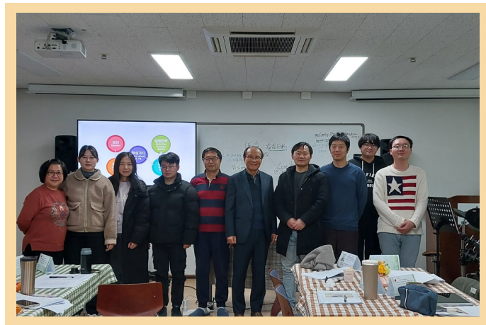
<그림 1> 안성 동아시아 신학대학원 코칭 세미나(2023.12.27-28)